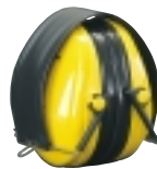
Zusammenklappbarer Kopfbügel H510F Beansprucht wenig Platz in Werkzeugkasten oder Jackentasche. Die Dichtungsringe sind vor Schmutz und Beschädigung geschützt.