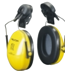
Helmbefestigung H510P3 Für Helme mit Schlitz. Die Gehörschutzkapseln können in Betriebs-, Lüftungs- und Ruhestellung gestellt werden.