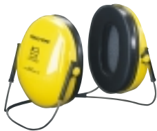
Nackenbügel H510B Zur Kombination mit anderer Schutzausrüstung, z. B. Schweißschirm.

Sehr vielseitig und besonders leicht: Trotz seines geringen Gewichtes ist Optime I der optimale Gehörschützer. Er hat ein schmales Profil, inwendig aber eine großzügige Tiefe. So lässt sich der Gehörschützer leicht mit anderer Ausrüstung kombinieren und bietet viel Platz für die Ohrmuschel. Optime I ist die ideale Wahl für alle, die für kurze oder längere Perioden einen Allround-Gehörschützer benötigen. Dieses Modell eignet sich hervorragend für leichtere Lärmbelastungen, wie sie beispielsweise in der Industrie in Werkstätten, Klempnereien und Druckereien vorkommen. Aber auch beim Rasenmähen oder lauten Hobby- und Freizeitaktivitäten ist Optime I ein passender Gehörschutz.