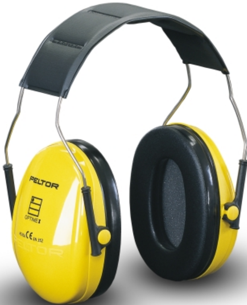
Kopfbügel H510A Rostfreier Federstahl. Weiche Polsterung – auch bei Daueranwendung sehr bequem.